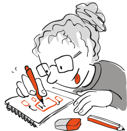
Sketch Notes - analog oder digital

Eine diskrete Form und das kleinste Format der Live-Visualisierungen hält sich im Hintergrund. Es greift nicht ein und ist die stille Begleiterin des Entwicklungsprozesses. Mit dem Zeichenblock oder Tablet in der Hand entstehen mobile Skizzen, die mit dem Beamer flexibel zu vergrößern sind.